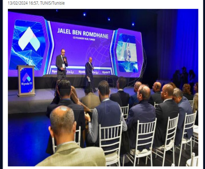
Tunis, 13 févr. (TAP)-Les travaux de la 11ème édition du festival de l'entrepreneuriat en Tunisie « Riyeda » ont démarré, mardi et se poursuivront jusqu'au 15 février 2024, avec la participation d'environ 15 000 visiteurs, dont la plupart sont des...